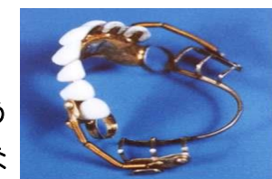
スプリング付入れ歯

西洋の入れ歯は動物の歯や骨、象牙の加工から始まりやがて陶製に進化。あの、イギリスの陶器メーカーの「ウェッジウッド」が作っていたというから驚きです。日本では食事目的で進化したのに対して、西洋で舞踏会などで使うおしゃれグッズ。食事の時は外して見栄えが目的でした。