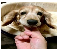
我が家の愛犬：ラッキー 13歳8ヶ月のおじいちゃん