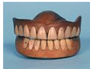
江戸時代の入れ歯

日本での入れ歯の歴史は室町時代に始まり「木床義歯」と呼ばれる物が作られていました。すでに現在と同じ様に上顎の粘膜に吸いつく構造をしています。当時は仏像の彫り師などが作っていて、江戸時代には専門の入れ歯師が登場。江戸幕府を開いた徳川家康も入れ歯を使っていた事が歴史書に記されています。