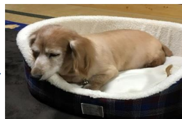
カットして心もち 少しだけ痩せてみえる様な

〒501-6224 岐阜県羽島市正木町大浦-79-2 TEL & FAX 058-394-4662 E-mail info@ham-dent.com Web http://www.ham-dent.com/