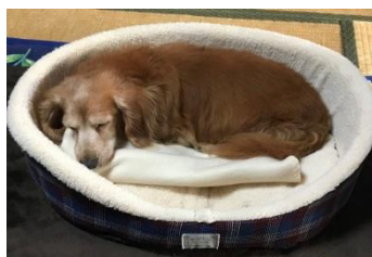
寝ている事が多くなり 最近太り気味(>_<)