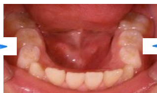
頬杖で歯列の歪み