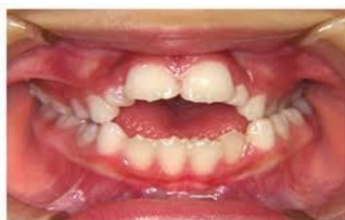
上・下の歯が閉じない